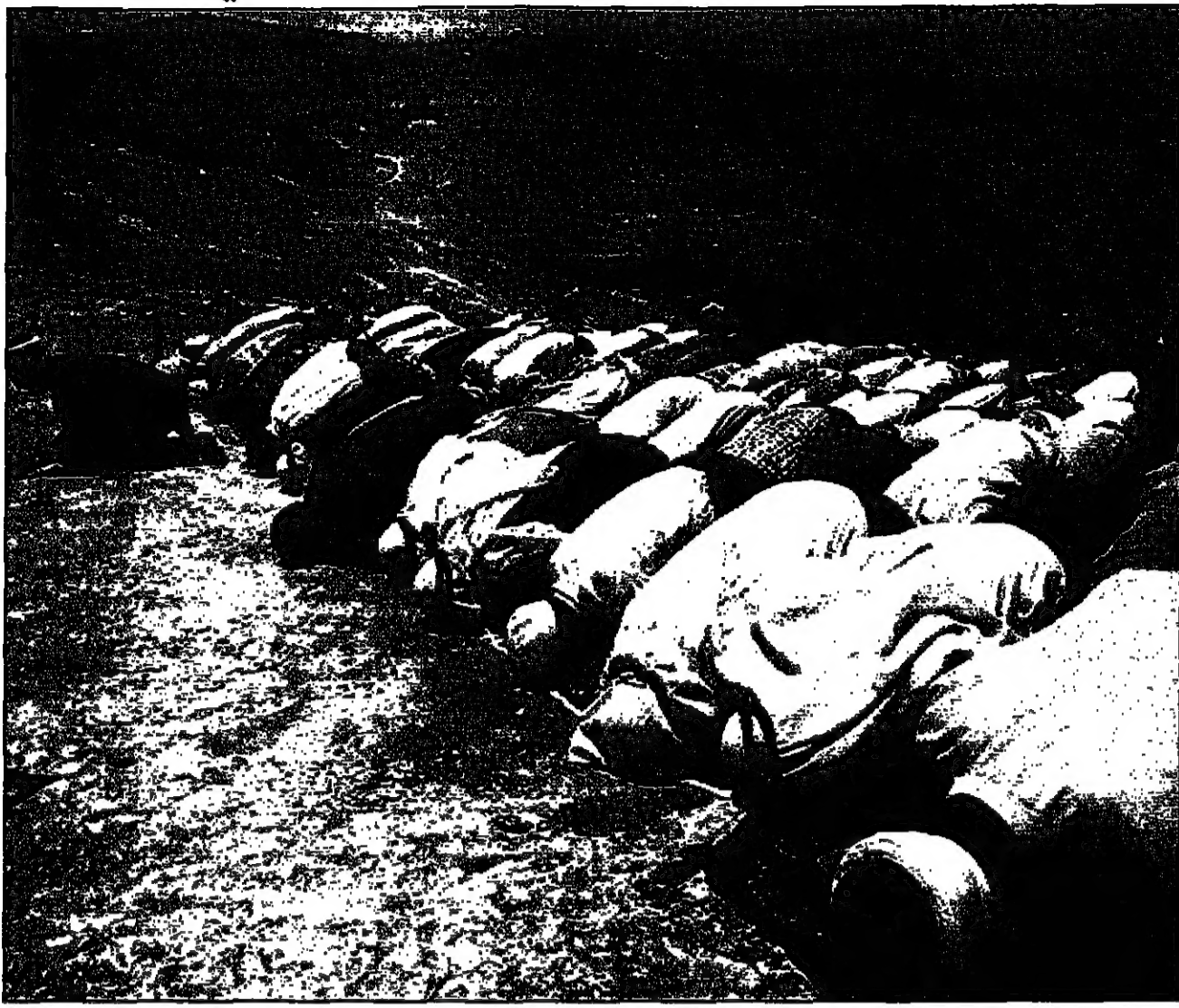
فلسطينيون يسلمون فوق اراض مهددة بالمصادرة في القدس

القدس - بيت لحم - الف: بعد المواجهات بين متظاهرين فلسطينيين في مدينة القدس الجمعة من مئات عدد من الفلسطينيين يتقدمون معنقون للجمعة وعدد من المتظاهرين فوق اراضي مهددة بالمصادرة في القدس الشرقية المحتلة والهدوء بالصادرة من قبل الاسرائيليين. وقالت هذه المصادر لوكالة فرانس برس ان حوالي ثلاثة الاف فلسطيني من سكان البساتين والقرى المجاورة للمتاحق بالهدوء بالمصادرة اقاموا شعائر الصلاة في ارض مهددة بالمصادرة في القدس الشرقية المحتلة والهدوء بالصادرة من قبل الاسرائيليين. وقالت هذه المصادر لوكالة فرانس برس ان حوالي ثلاثة الاف فلسطيني من سكان البساتين والقرى المجاورة للمتاحق بالهدوء بالمصادرة اقاموا شعائر الصلاة في ارض مهددة بالمصادرة في القدس الشرقية المحتلة والهدوء بالصادرة من قبل الاسرائيليين. وقالت هذه المصادر لوكالة فرانس برس ان حوالي ثلاثة الاف فلسطيني من سكان البساتين والقرى المجاورة للمتاحق بالهدوء بالمصادرة اقاموا شعائر الصلاة في ارض مهددة بالمصادرة في القدس الشرقية المحتلة والهدوء بالصادرة من قبل الاسرائيليين.